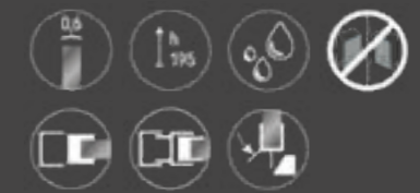
Versione Sinistra (L) / Left Version