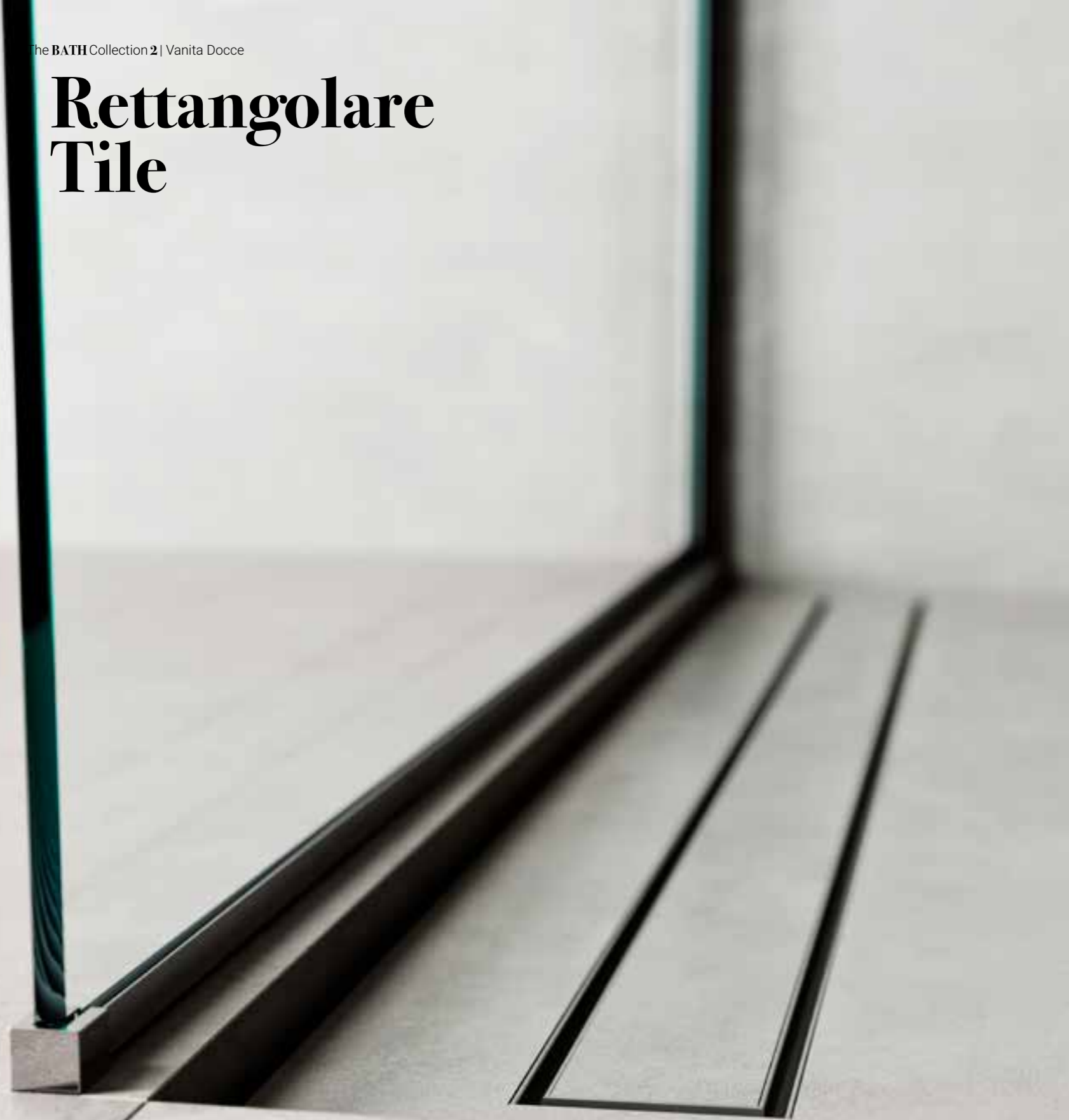
Canalina doccia con cover predisposta per piastrella / Shower drain with tile arrangement cover