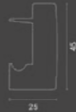
Profilo superiore / Upper profile