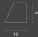
Profilo di contenimento / Containment profile