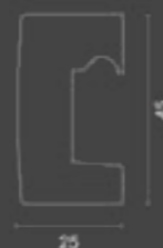
Profilo inferiore / Bottom profile