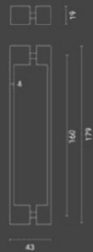
Maniglia / Handle